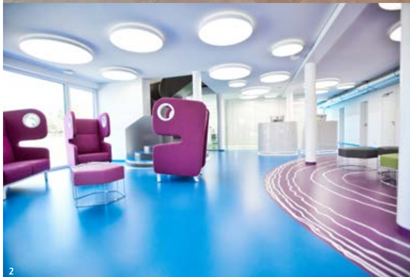
Abb. 1: Sitzlounge als Eyecatcher in kräftigem Orange. – Abb. 2: Kräftige Farben erzeugen eine fröhliche und angstfreie Atmosphäre.

Die Frage nach der Farbigkeit steht bei einer Beratung durch ein Unternehmen mit Schwerpunkt Innenarchitektur mit im Zentrum der Entwicklung ihrer Praxis. Es bringt immer eine belebende und freundliche Wirkung, in einer Praxis mit einer Akzentfarbe zu arbeiten (Abb. 1 und 2). Bei kräftigen Farben, wie im gezeigten Beispiel, kommt es auf einen sensiblen Umgang mit der Farbe an. Sie wird hier ganz bewusst nur in eini-