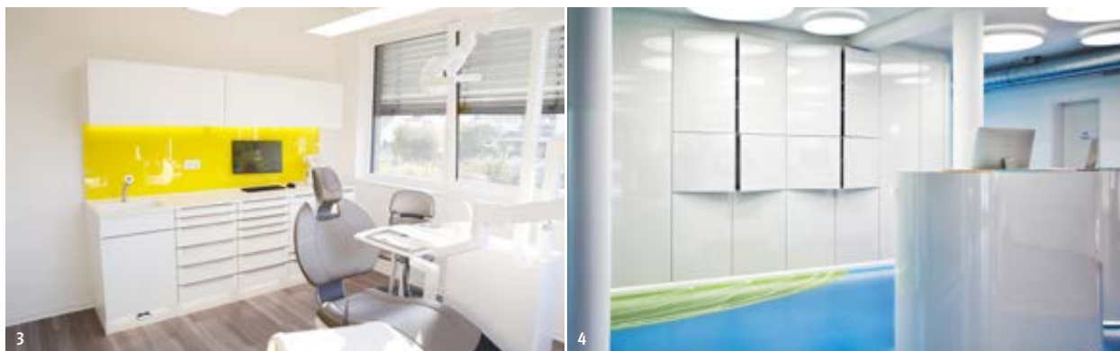
Abb. 3: Wandschutz in Logofarbe belebt die Einrichtung des Behandlungszimmers. – Abb. 4: Der Empfangsbereich mit farbig gegossenem Bodenbelag.

gen Details und Flächen eingesetzt, sodass die Gesamtwirkung der Praxis nach wie vor ruhig und zeitlos ist. Für eine zeitlose Einrichtung ist es wichtig, die Farbe in „wandelbaren“ Flächen einzusetzen. So kann zum Beispiel die Sitz-lounge, wenn sich der Farbgeschmack oder die Logofarbe im Falle einer Praxisübernahme geändert hat, in einer neuen Farbe bezogen werden. Ebenso besteht die Möglichkeit, ein Wand-schutzelement auszutauschen. Um eine solche Option zu nutzen, sollte Ihr Praxisplaner die Einrichtung selber produzieren, dann ist so ein „Facelifting“ der Praxis nach einiger Zeit ohne Probleme machbar.